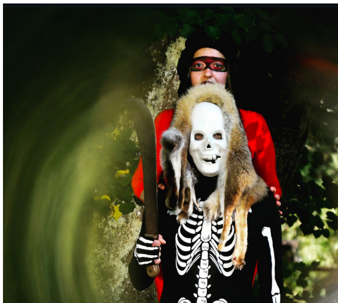
Fumo Nero

Mewrant est un héritier de la techno des années 90, il applique un style auto-proclamé de «Free-Techno». Sèche et légèrement acidifiée, sa musique se constitue en succession de boucles improvisées. Pour chaque Live il se constitue un setup particulier manifestant une volonté de repartir au point zéro de ses compositions.