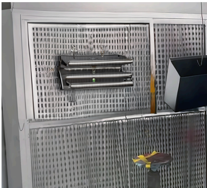
Mewrant, Essais_Fichaux 2023

Le concert de Fumo Nero aura lieu le 5 avril à partir de 20h, et sera suivi d'un DJ set de Mewrant .