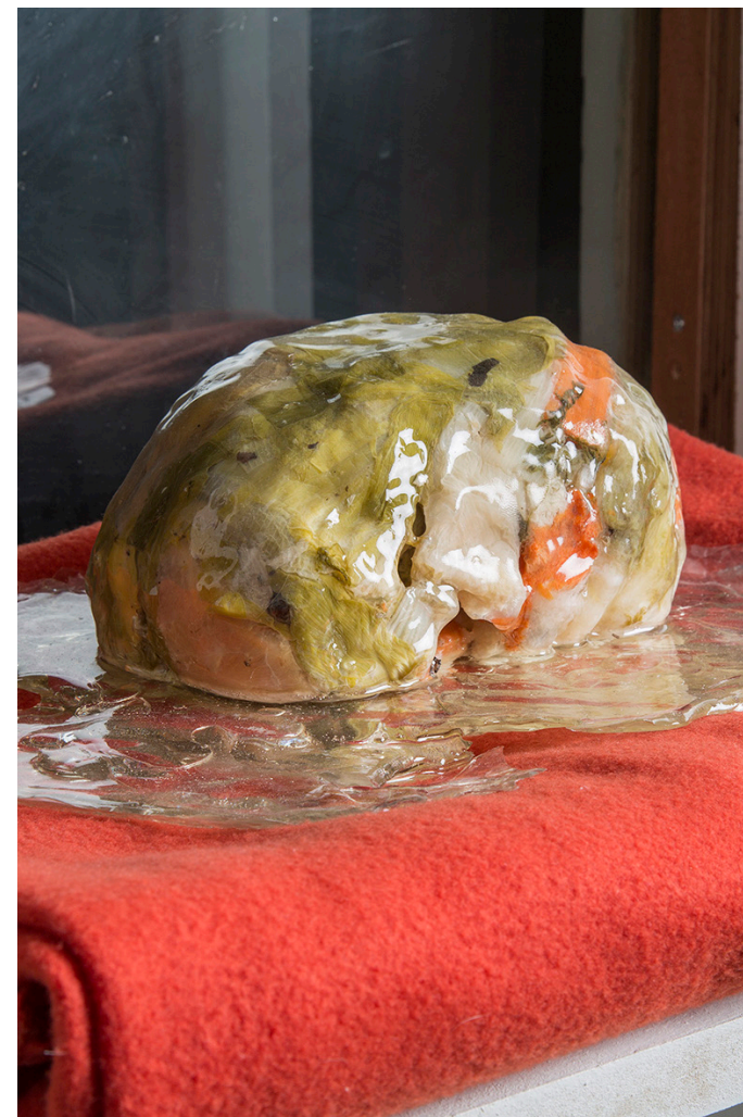
Grégoire Bergeret « Bouillon », 2017, Exposition « Maquereau fumé » à After Howl Studio