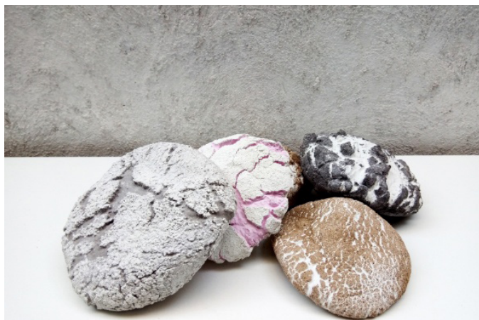
Linda Sanchez, « Pains », 2022 ciment, sable dimensions variables (environ 5 x 15 x 15 cm) © Linda Sanchez

Depuis plusieurs années, l'artiste développe un travail plastique entre sculpture, installation, dessin et vidéo. De l'horizontalité d'un plan d'eau à la trajectoire d'une chute, de la liquidité du sable à l'élasticité d'un liant, elle observe des phénomènes existants, les déplace, ajuste leur échelle, leur corrélation, leur durée. Les notions de hasard, d'ordre, de chute et de rapport au temps alimentent sa pratique. Ses oeuvres fixent le mouvement dans la matière, l'écrivent, le mesurent ou le transcrivent. Procédés, opérations, mécaniques et systèmes sont autant de modes de fabrication qui trouvent leur équivalence dans le langage de l'artiste. Son rapport à l'énonciation sous-tend, comme un script, un rapport non autoritaire au matériau en mouvement.