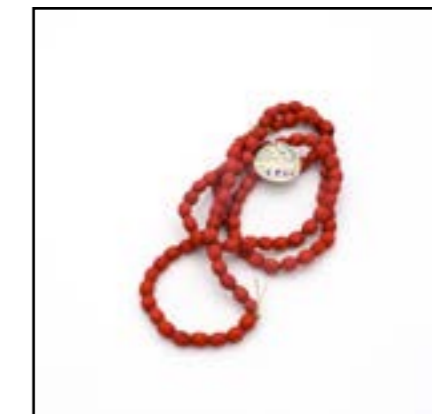
« Collections » page 8