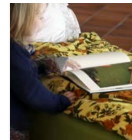
« Lieux communs » page 12