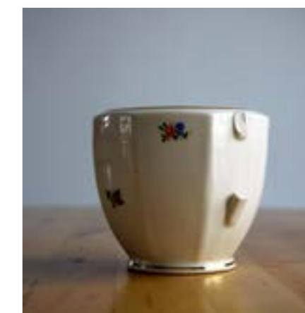
« 1947 » page 14