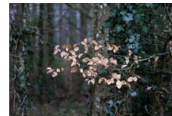
« D'hivers » page 6