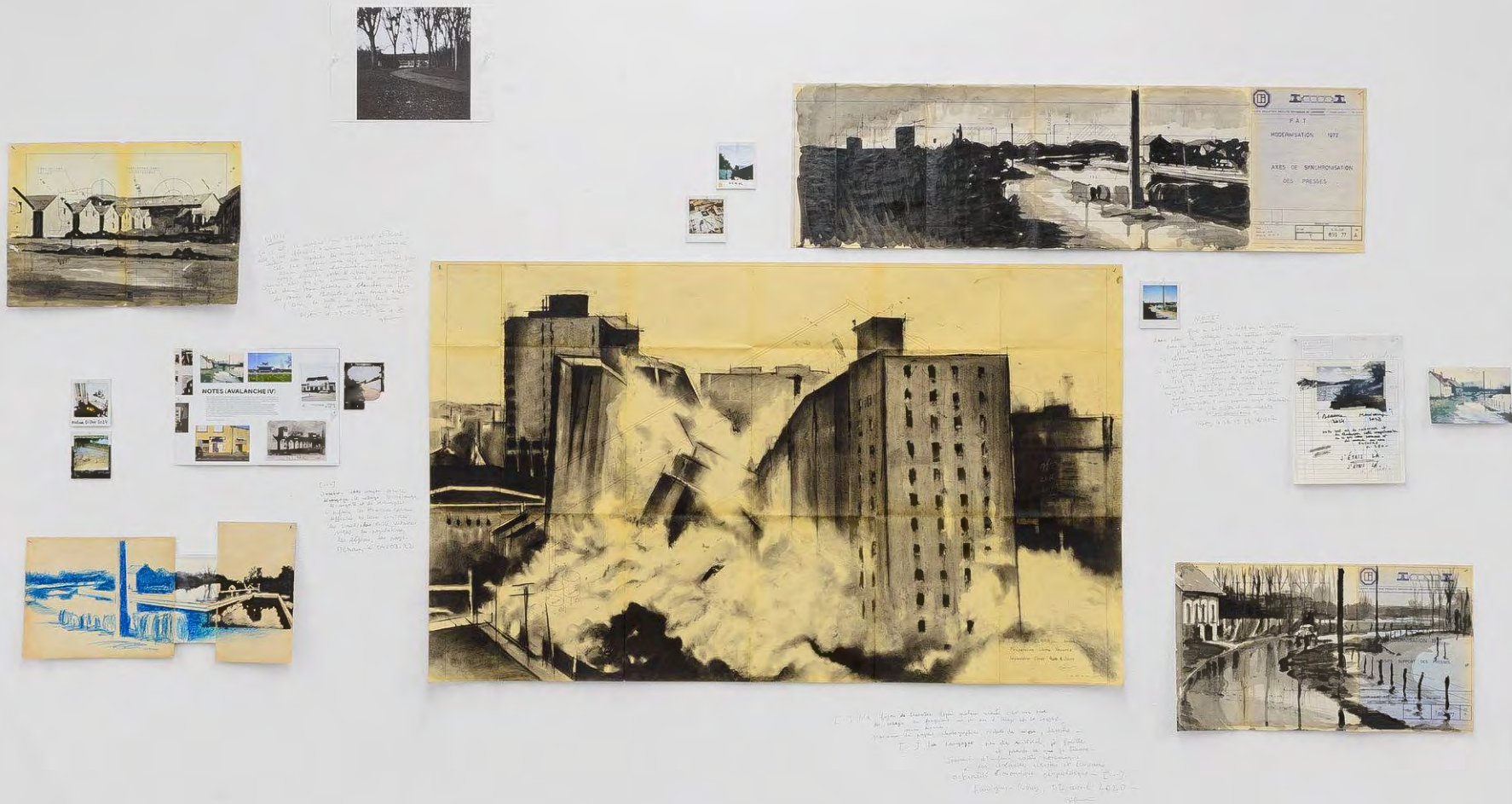
Galerie Sator (Marais), J'étais là , exposition personnelle, cur. Lise Traino, Paris, FR, 2024

J'étais là (mur de recherches) , 2024, ensemble de pièces. Fusain, encre de Chine, crayon de couleur et marqueur sur divers papiers trouvés, Polaroids, photocopie, clous, leporello Avalanche 4 et textes personnels écrits au crayon mine sur le mur.