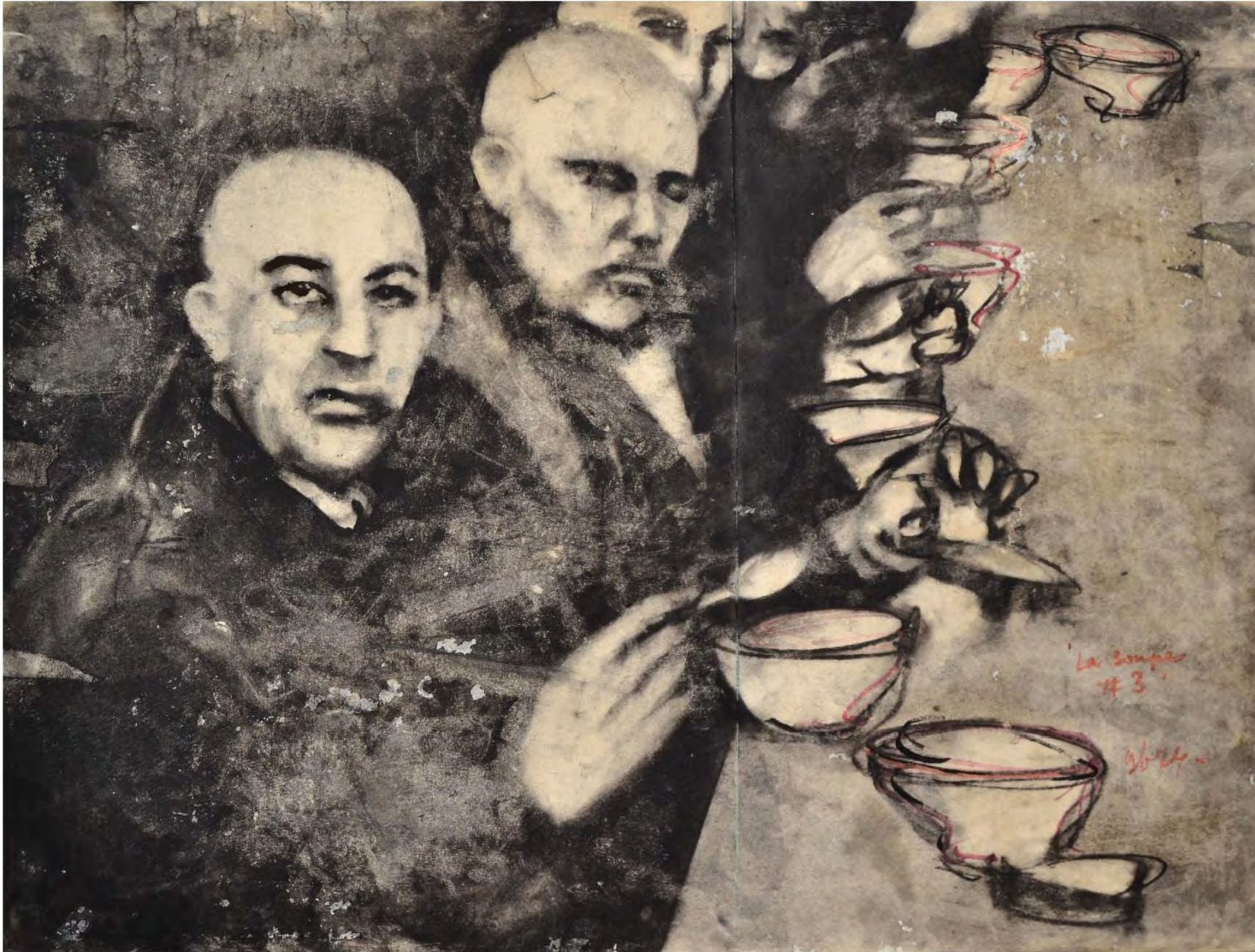
La Soupe #3, 2024, fusain, café et crayon de couleur sur papier peint, 53,5 x 70,5 cm