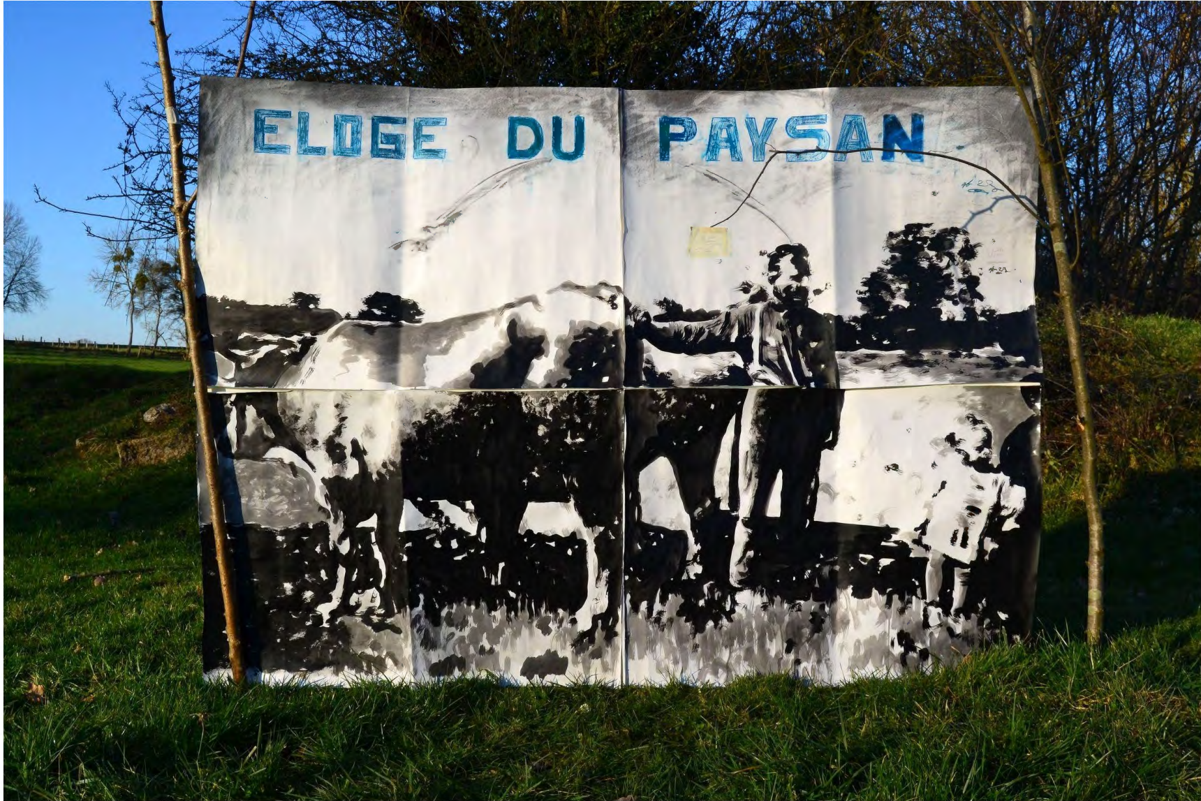
Eloge du paysan , 2023, encre de Chine, fusain, pastel et crayon de couleur sur papier, 150 x 215 cm. Vue d'installation éphémère, Hauts-de-France