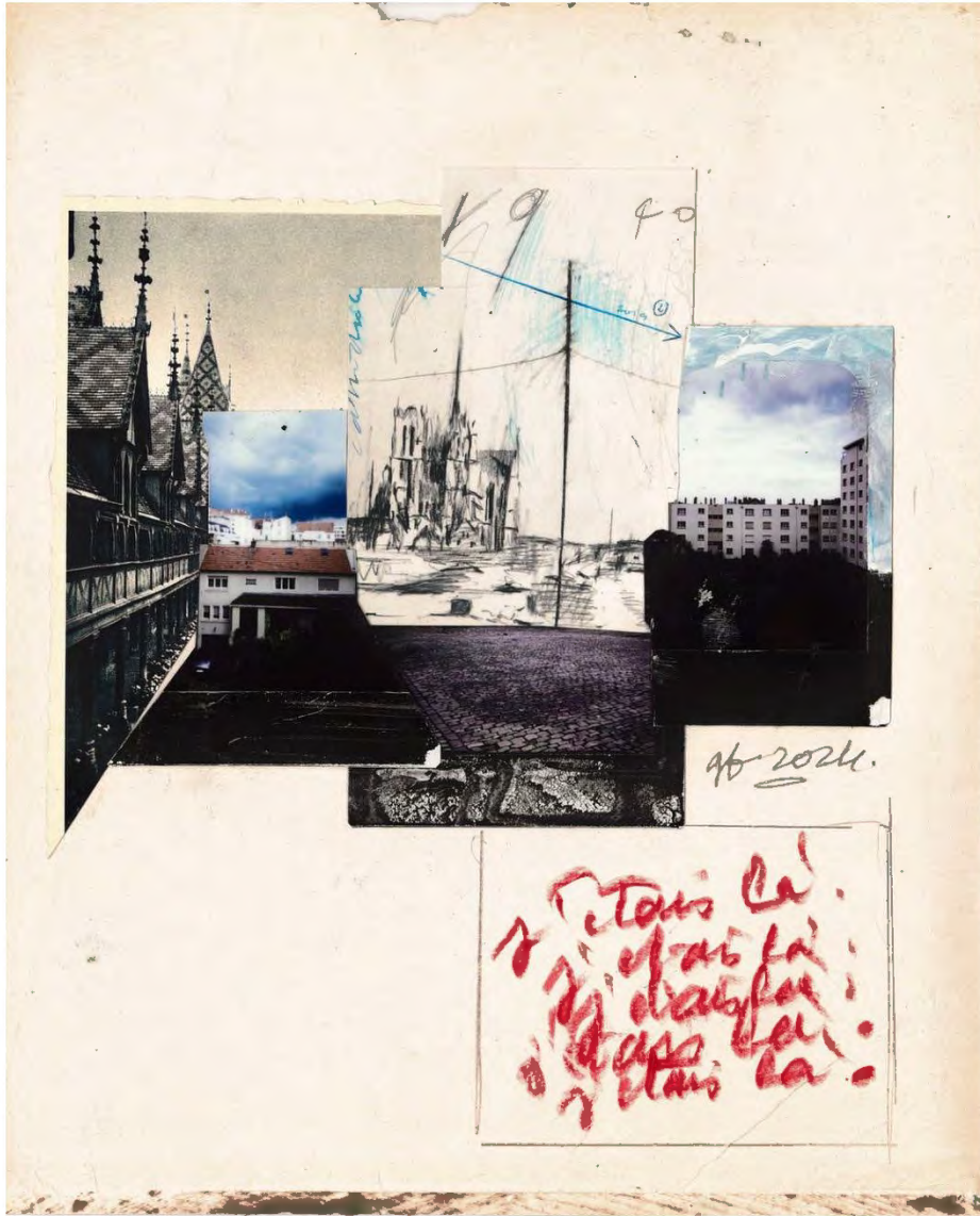
J'étais là, 2024, technique mixte sur papier, 26 x 21,5 cm