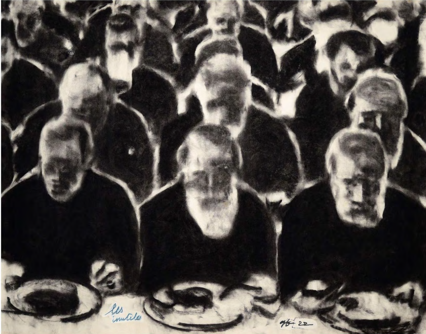
Les Inutiles, 2022, fusain sur papier peint, 53 x 67 cm, collection privée