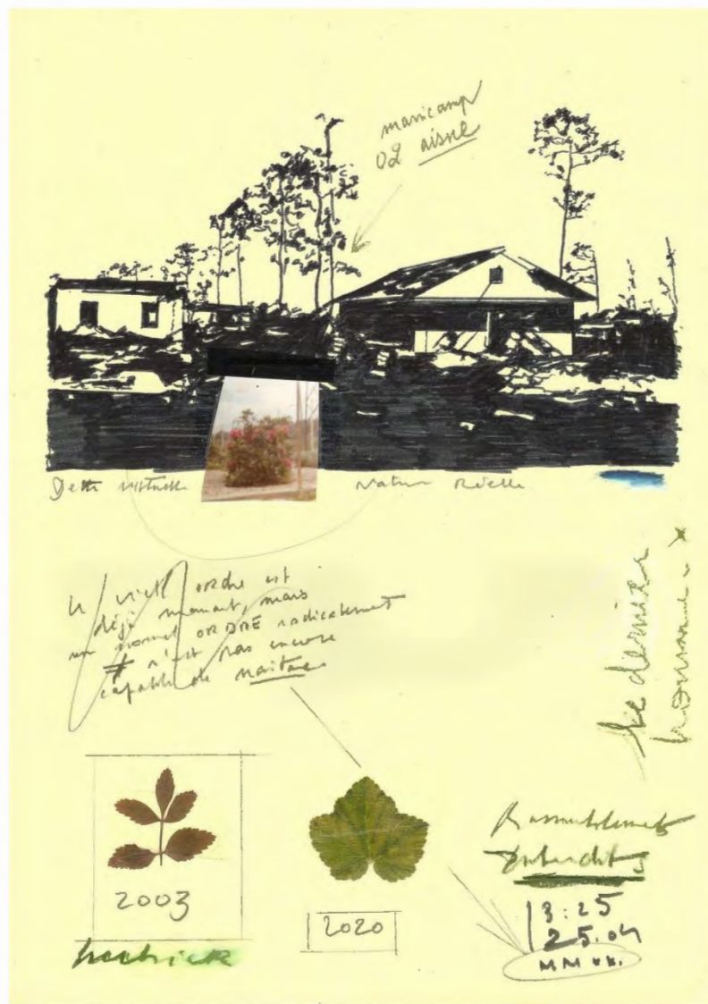
Post-contemporain, 2021 , marqueur, crayon de couleur, graphite et collage sur papier peint, 29,7 x 21 cm, collection privée