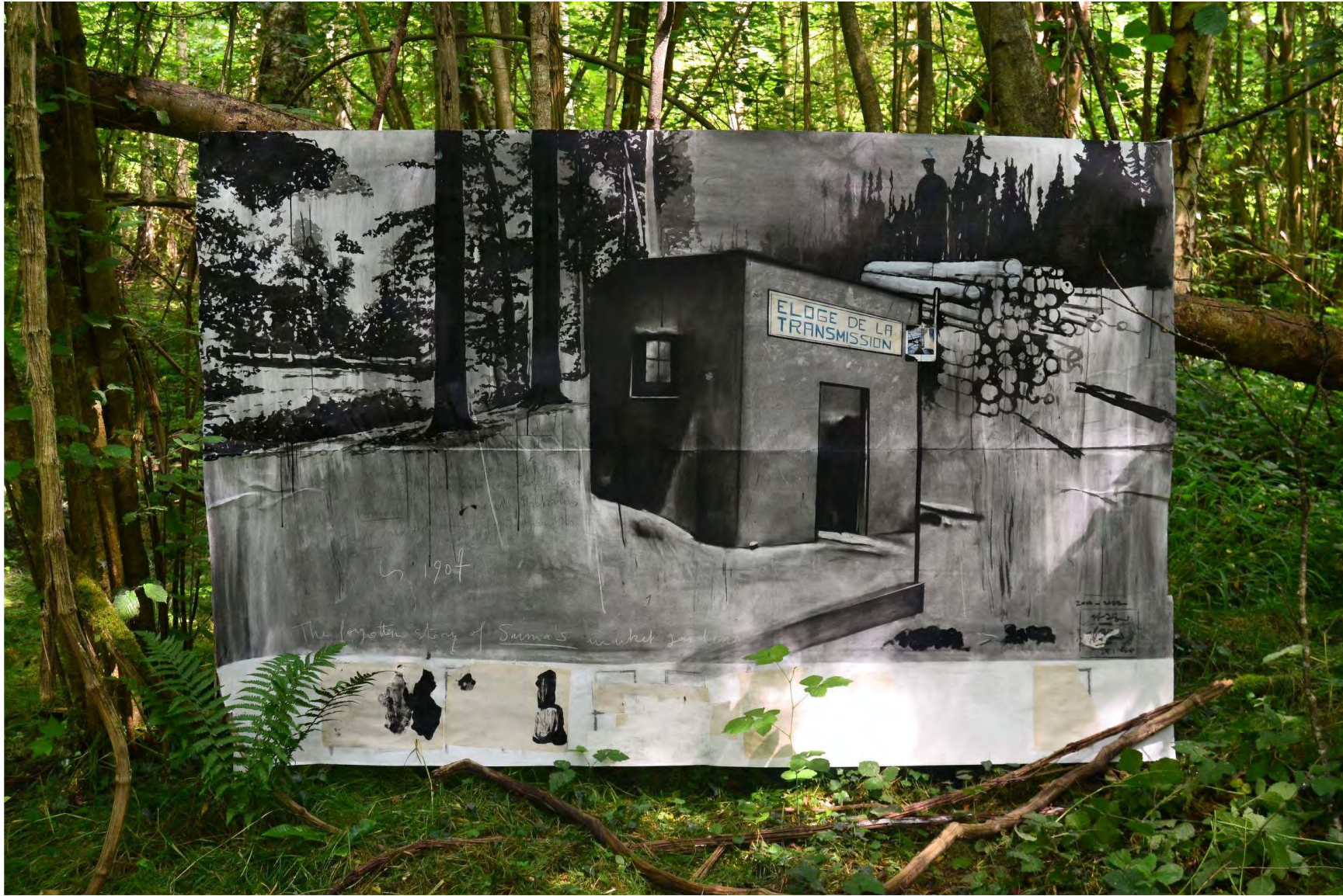
Eloge de la transmission , 2017 – 2023, fusain, encre de Chine, pastel, crayon de couleur et Polaroid sur papier, 150 x 230 cm. Vue d'installation éphémère, Hauts-de-France