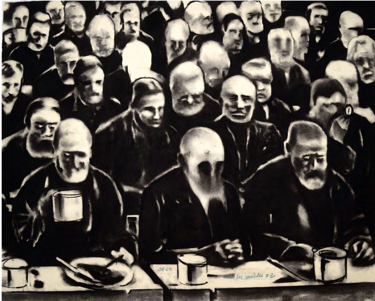
Les Inutiles #2, 2024, fusain sur papier peint, 53 x 67 cm