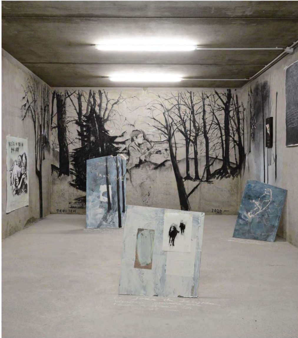
Le Box, La Terre entière pour tombeau , exposition personnelle, Toulouse, FR, 2020