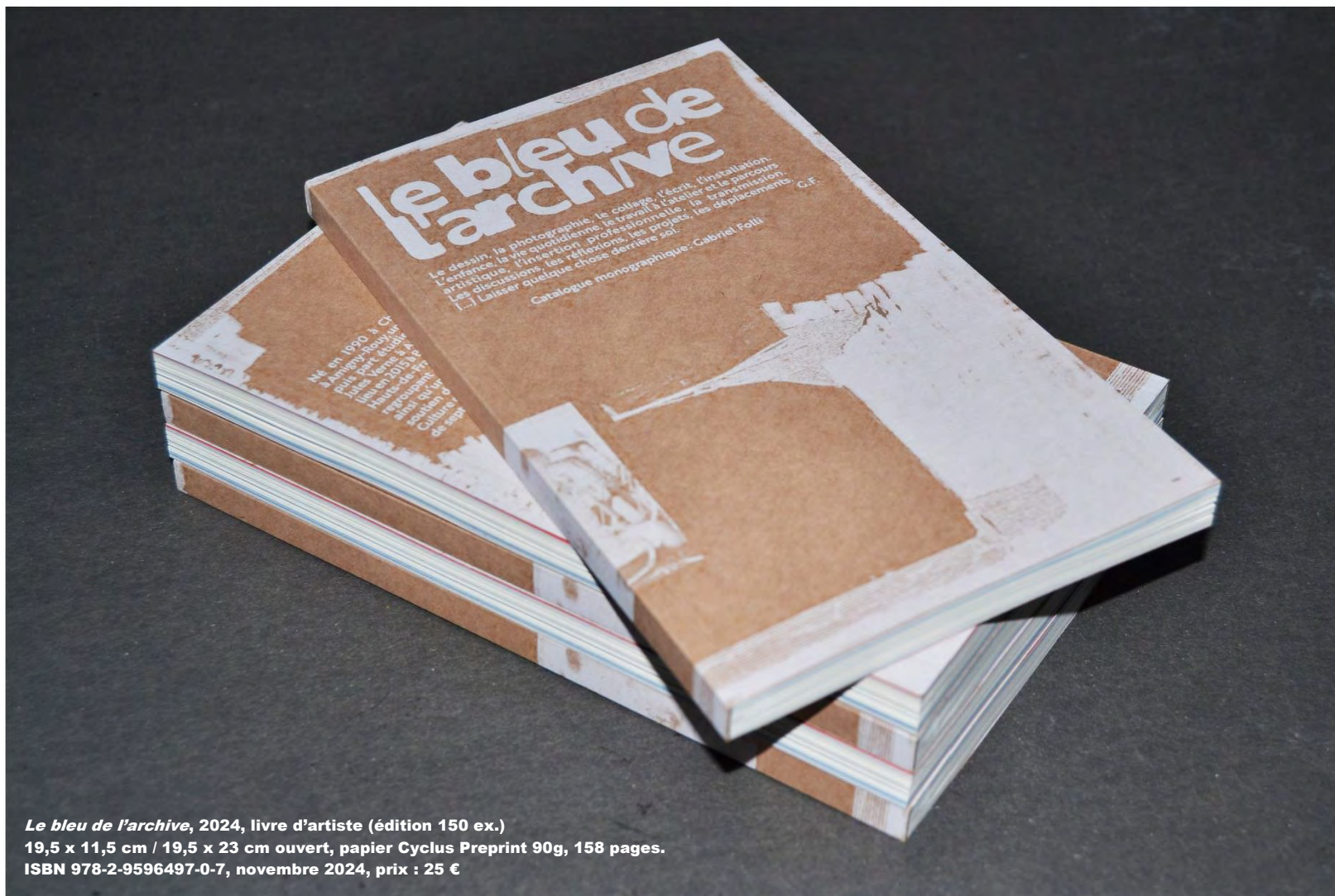
Le bleu de l'archive , 2024, livre d'artiste (édition 150 ex.) 19,5 x 11,5 cm / 19,5 x 23 cm ouvert, papier Cyclus Preprint 90g, 158 pages. ISBN 978-2-9596497-0-7, novembre 2024, prix : 25 €