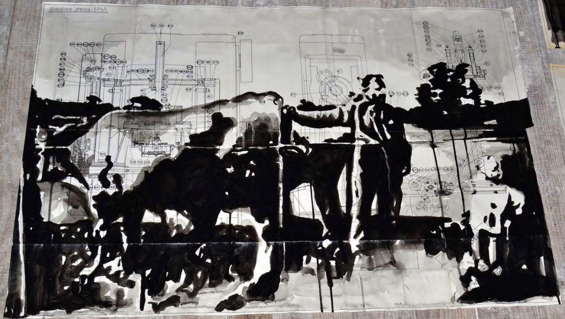
Eloge du paysan , 2024, encre de Chine sur plan, 62 x 89 cm Vue d'atelier, Les Ateliers DLKC, Saverdun (Ariège), FR. Avec le soutien de la DRAC Occitanie.