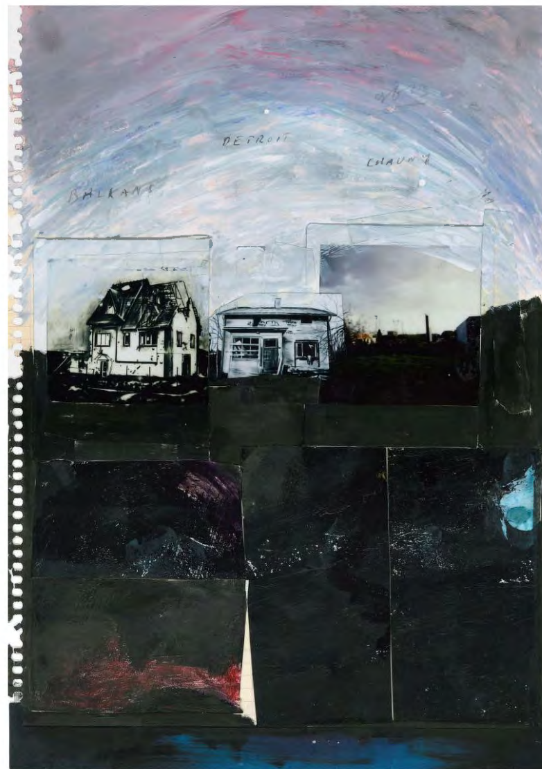
Semena Mertvykh ( A storm is coming ), 2023, crayon de couleur, encre, 4 Polaroids découpés et ruban adhésif sur papier, 29,7 x 21 cm, collection privée Semena Mertvykh ( Balkans x Detroit x Chauny ), 2023, crayon de couleur, encre, 3 Polaroids découpés, ruban adhésif et collages sur papier, 29,7 x 21 cm