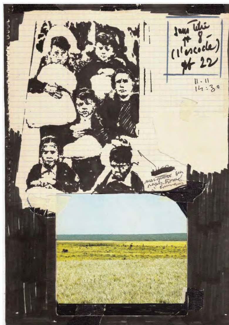
Sans titre (Ouvriers), 2023 , marqueur, crayon de couleur, crayon mine, Polaroid et plastique sur papier, 29,7 x 21 cm