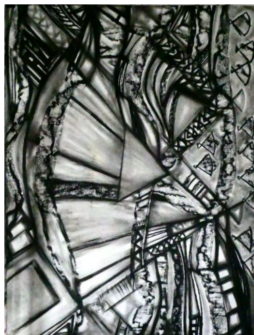
Sans titre (2021). Fusain sur papier. 150 x 116 cm.