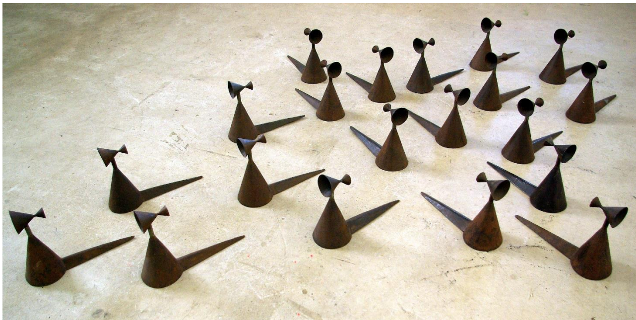
Sans titre, Installation. Fer soudé. 50 x 50 x 20 cm