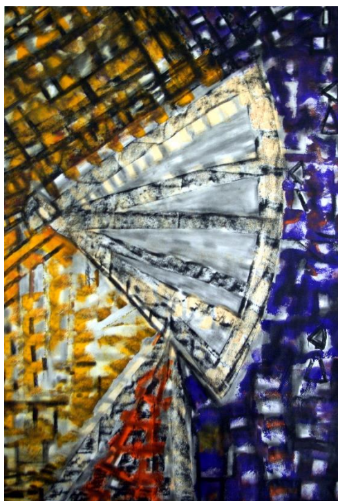
Sans titre (2017). Acrylique et fusain sur papier. 177 x 120 cm (Collection particulière)