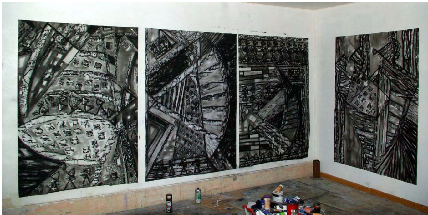
Série de Fusains sur papier 177x120 cm (2017 à 2021)