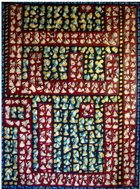
Insaaniyaâ - Humanité (2020), Acrylique sur toile. 200x147cm