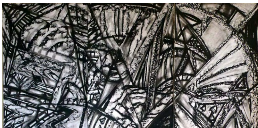
Sans titre (2020). Fusain sur papier. Triptyque. 120 x 80 cm