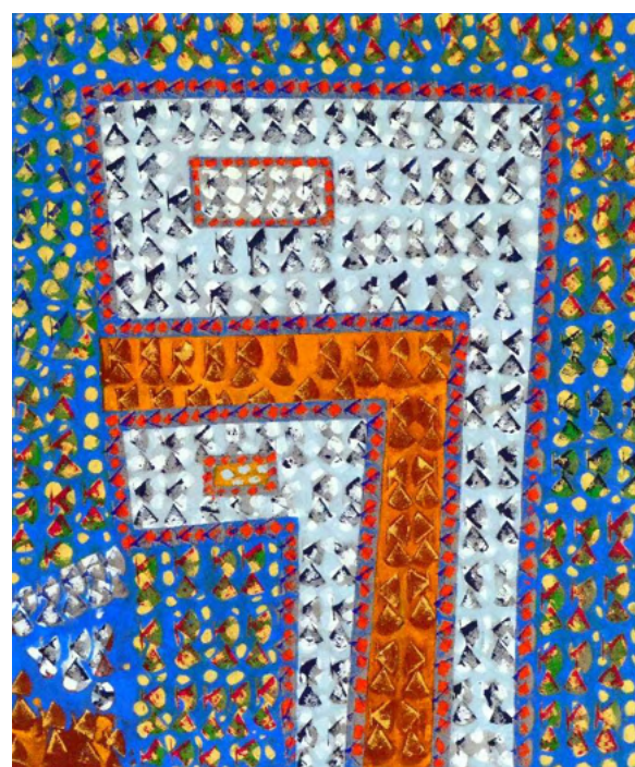
Taâ (2021), acrylique sur toile. 200 x 147 cm