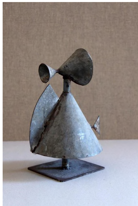
Module, fer. 40 x 20 x 20 cm