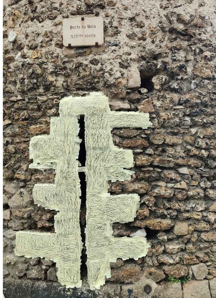
Empreinte d'une des meurtrières de la Porte du Bois.

Pour la première fois, elle allie ce travail d'empreinte par frottages à la technique du transfert photographique qui lui permet de retranscrire la ville et les différentes temporalités qui la traversent. Plusieurs niveaux de lecture apparaissent dans les formes plastiques créées par l'artiste Anna L'Hospital. La notion de carte, comme on l'entend limiter les continents et les pays, s'émancipe au gré des empreintes réalisées par l'artiste, proposant une cartographie du souvenir sous la forme de plusieurs fragments temporels.