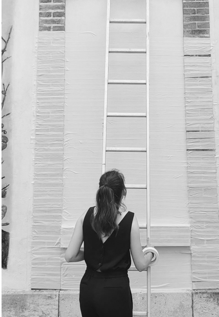
Empreinte d'une des fenêtres condamnées du Conservatoire de Musique.