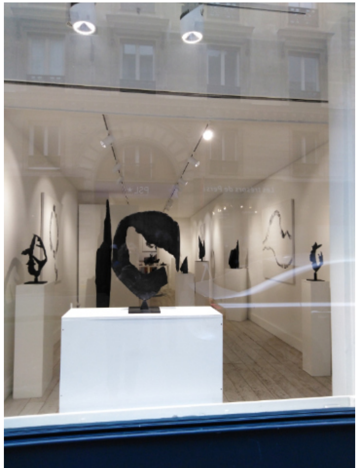
Galerie Cyril Guernieri - Paris et Honfleur