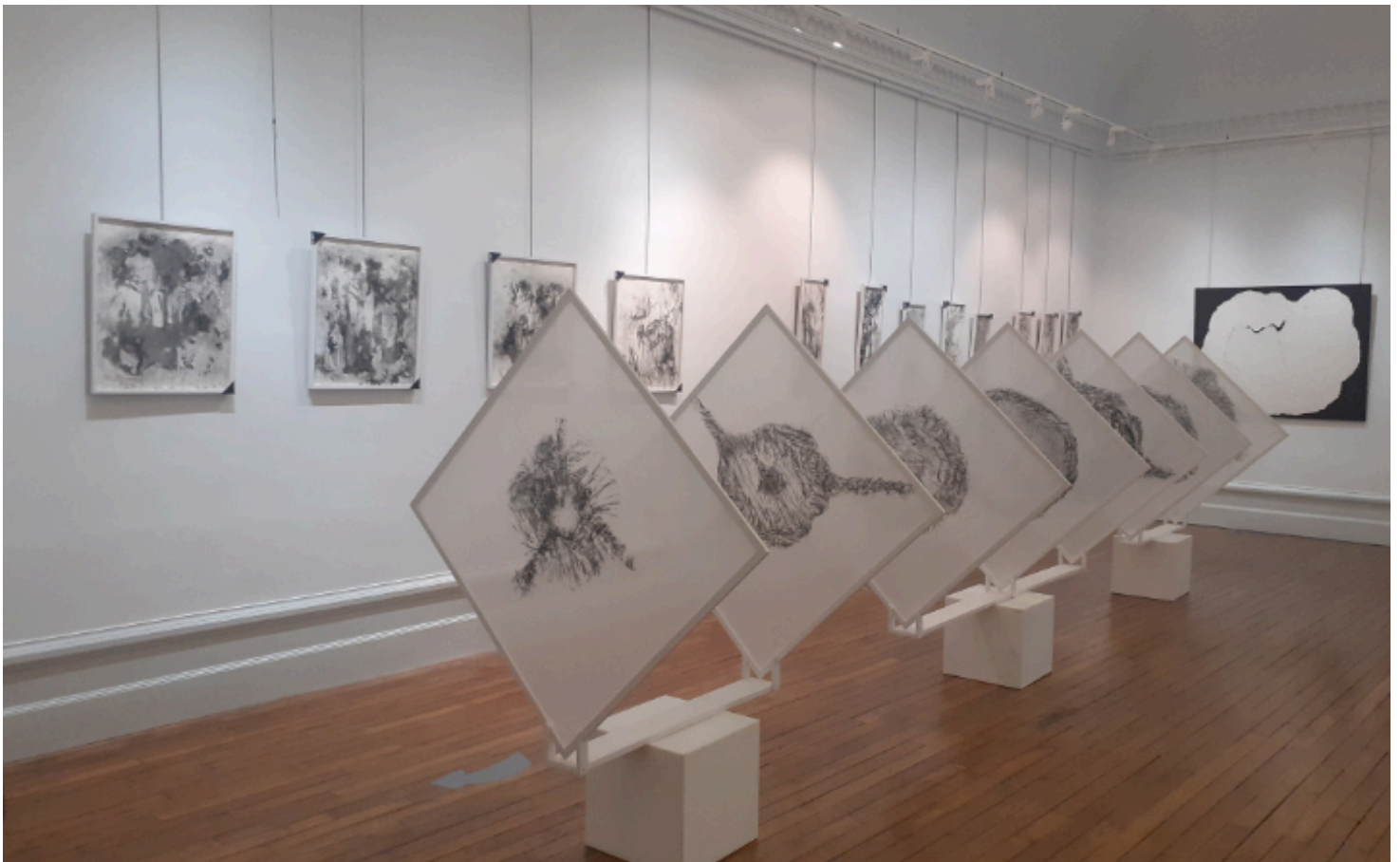
Musée Baron Martin Gray Installation «Arbre», monotype, personnage sur le fil - 2023-2024