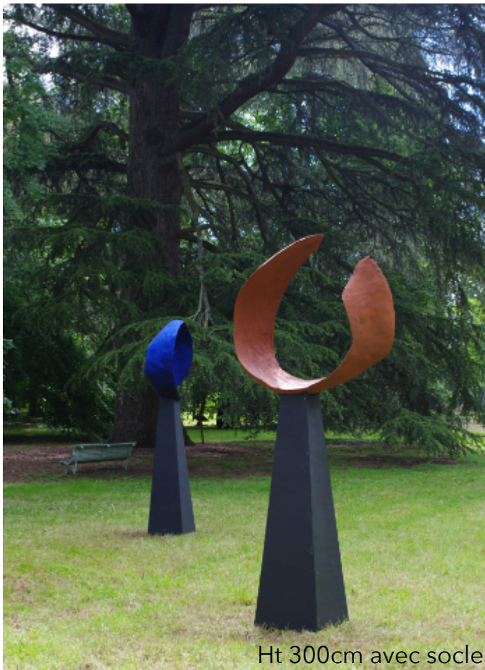
Ht 300cm avec socle