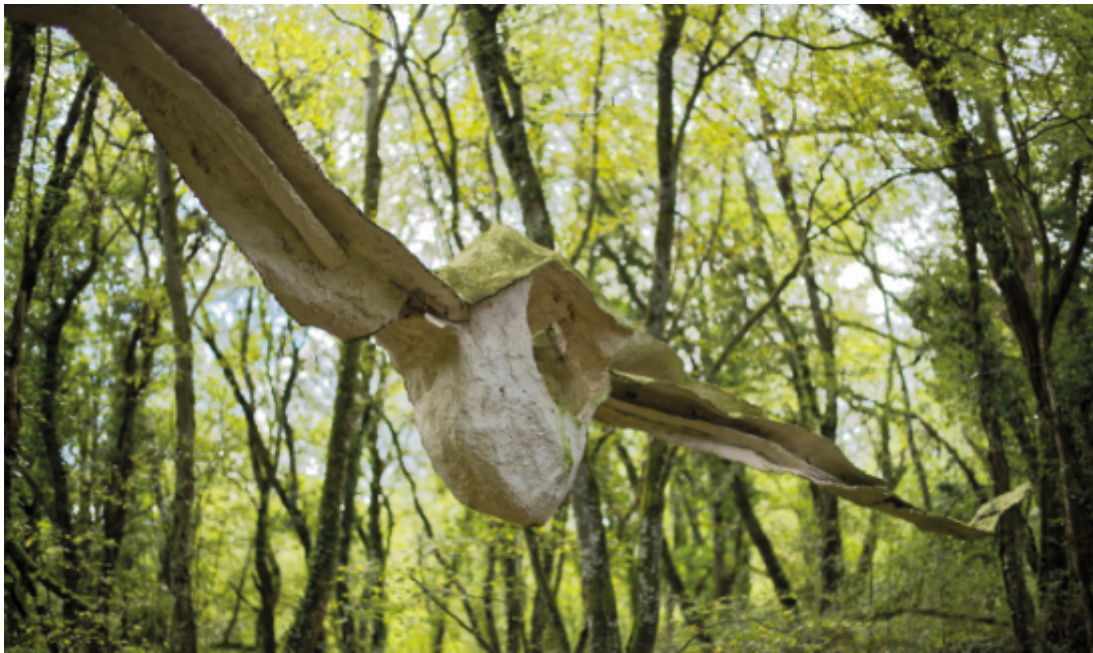
Parcours de Sculptures Ile art Malans 70 installation sonores Résonance Onde Sonore