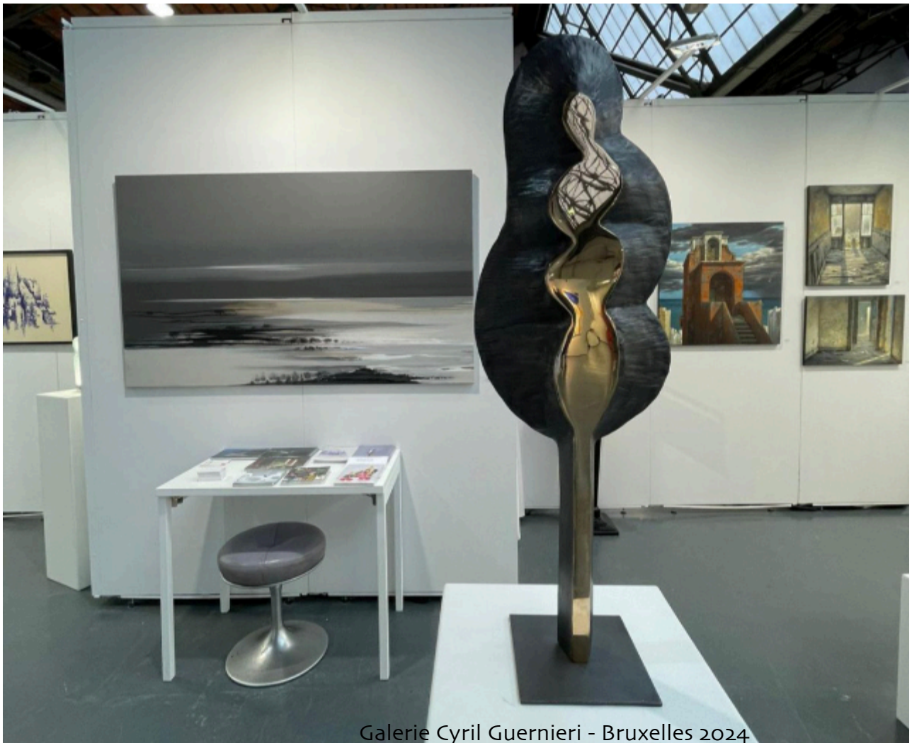
Galerie Cyril Guernieri - Bruxelles 2024