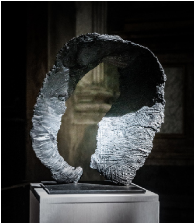
MAC 3 Dole - 2016